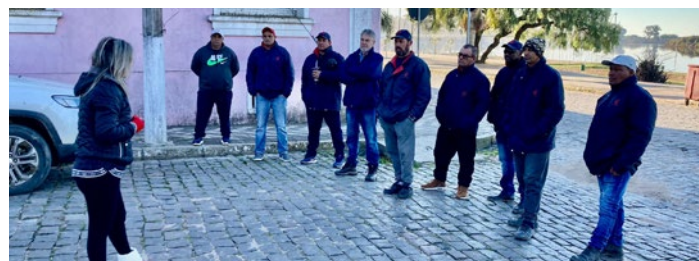
Passeio guiado na cidade