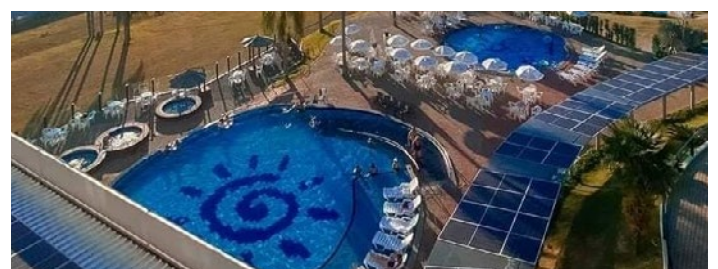
Termas de Machadinho