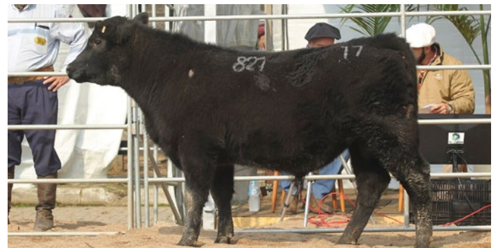
Santa Nélia 827