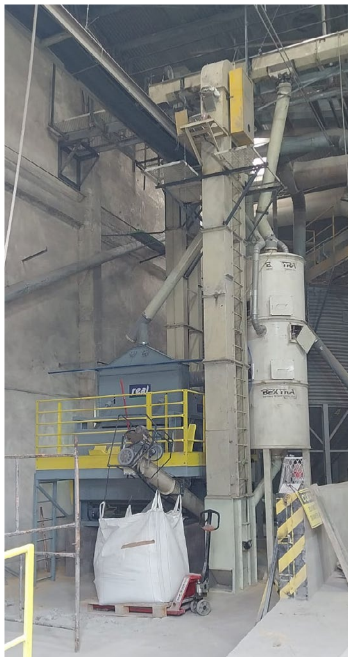
Instalação peneira nova

mos de eficiência operacional, qualidade do produto e sustentabilidade. As melhorias na limpeza do arroz, na captação de pó e na economia de energia estão contribuindo para um processo de produção mais limpo, seguro e rentável, alinhado às exigências do mercado atual e à crescente preocupação com a preservação ambiental.