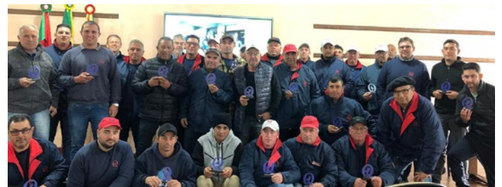
Equipe São Francisco