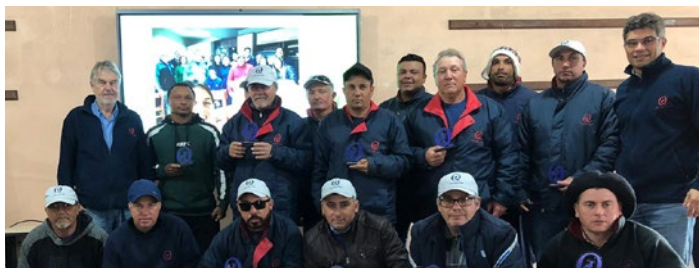
Equipe Santa Maria