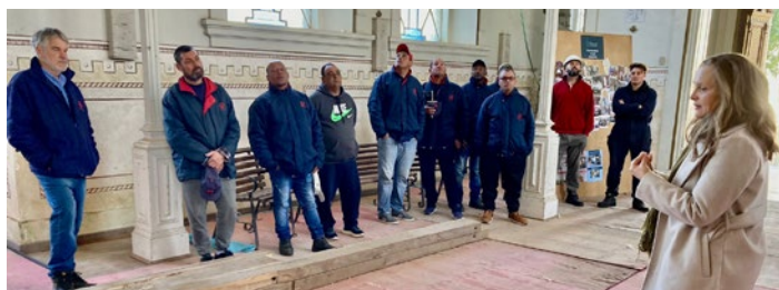
Arquiteta apresenta projeto

Esse passeio turístico foi finalizado com um delicioso café da manhã, como presente aos aniversariantes.