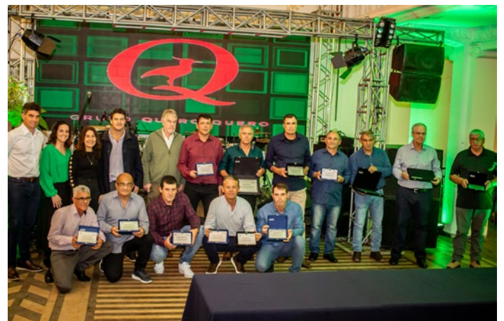
Colaboradores recebem placa