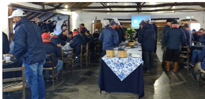
Inovações anunciadas ao sabor de um café