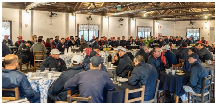
Os colaboradores da Quero-Quero Agro, no CTG