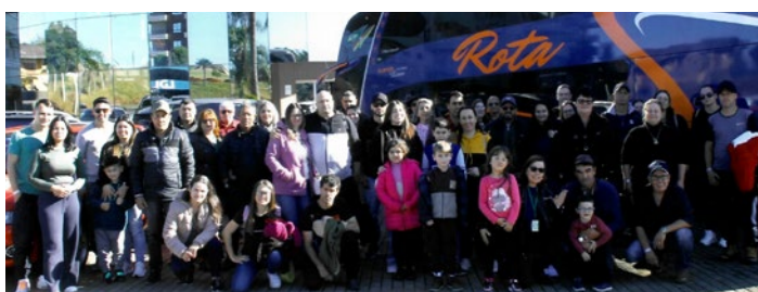
Colaboradores em excursão para Machadinho